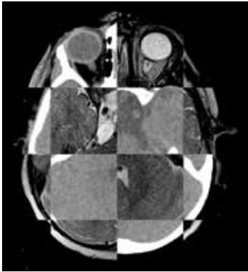
Abb. 1: Bildüberlagerung von Planungs-Computertomographie (CT) und -Magnetresonanztomographie (MRT); Darstellung im Schachbrettmuster.

(Image-Guided Radiotherapy, IGRT). Die hierdurch erreichte Verbesserung der örtlichen Zuordnung von Dosis und Zielgebiet ermöglicht eine Reduzierung der Sicherheitssäume einer Bestrahlung und damit die Schonung von gesundem Gewebe.