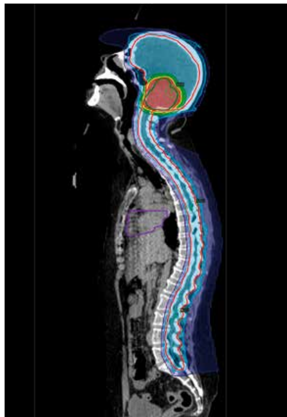
Abb. 3: Protonen-Bestrahlungsplan einer Bestrahlung der kraniospinalen Achse: Blaue Fläche: Zielvolumen kraniospinal, rote Fläche: Aufdosierung Tumorbett, violette Kontur: geschontes Herz.

Tumoren des ZNS wurden noch bis in die 1980er Jahre nahezu immer gleich behandelt. Eine Unterscheidung von Diagnose, genauer Lokalisation und Tumorstadium wurde hinsichtlich der Dosis und des Bestrahlungsvolumens kaum vorgenommen. Dies führte dazu, dass häufig das gesamte ZNS, die sogenannte kraniospinale Achse (Gehirn und Spinalkanal), bestrahlt wurde. Moderne Strahlentherapiekonzepte hingegen erlauben eine dem Risiko angepasste Behandlung mit Berücksichtigung der